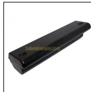
Bateria de litio compatible HSTNN-DB72 para portátiles COMPAQ PRESARIO CQ40, CQ50, CQ60, CQ70