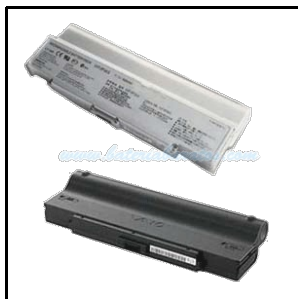
Bateria de litio compatible VGP-BPS9/B / VGP- BPS9A/B en color negro para portátiles Sony Vaio.