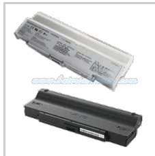
Sony VGP-BPS9/S Capacidad :10400mAh Tensión :11.10 V precio actual:6 1.45 EUR