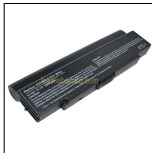
Bateria de litio compatible VGP-BPS2B / VGP-BPS2A / VGP-BPS2 para portátiles Sony Vaio.