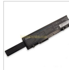
Batería Studio 1737 Capacidad :5200mah Tensión :11.10 V precio actual:43.82 EUR

Batería HP 8540p Capacidad :4400mAh Tensión :14.4v Color :negro precio actual: 42.30 EUR