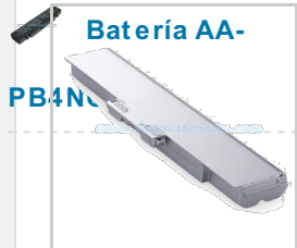
Batería AA- PB4N Sony VGP-BPS21 Capacidad :8800mAh Tensión :11.10 V precio actual:48.65 EUR

2515 Garantía del fabricante de un año. 100% compatible garantizado, Las compras con nosotros son 100% seguras.