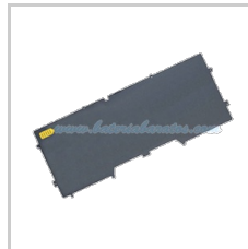
Batería DELL XPS 13 Capacidad :47Wh Tensión :11.10 V precio actual:113.39 EUR