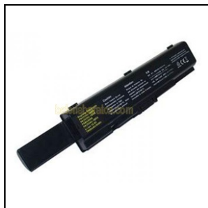
Bateria de litio compatible TOSHIBA PA3534U-1BRS / TOSHIBA PABAS098 para portátiles Toshiba Satellite>>